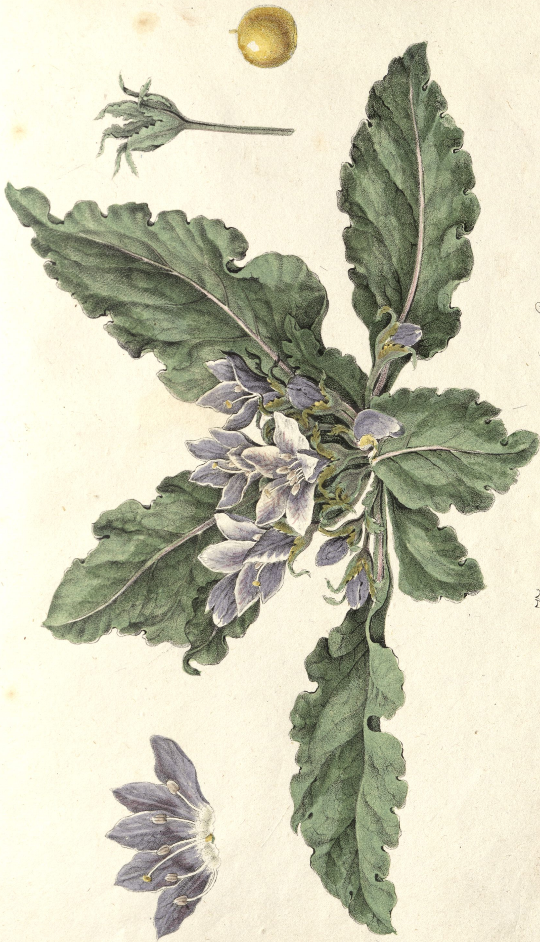
Mandragora microcarpa Bert. Com.