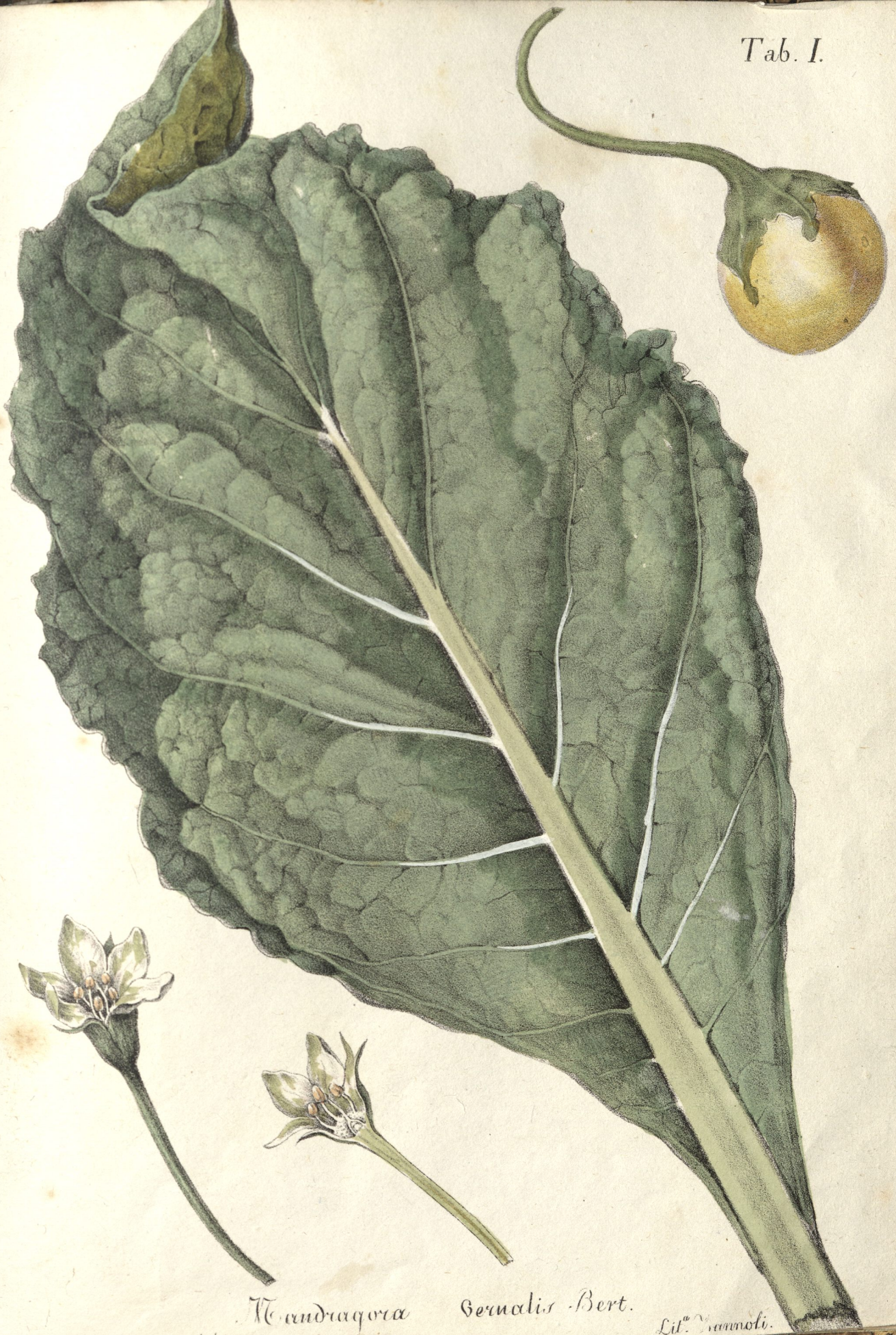
Mandragora sernolis Bert.